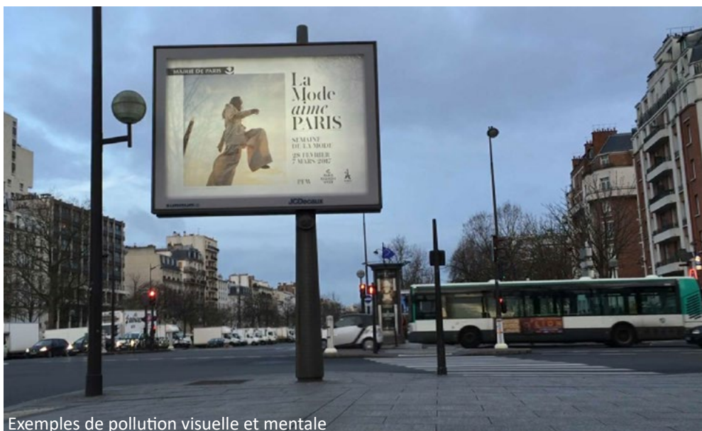
Exemples de pollution visuelle et mentale