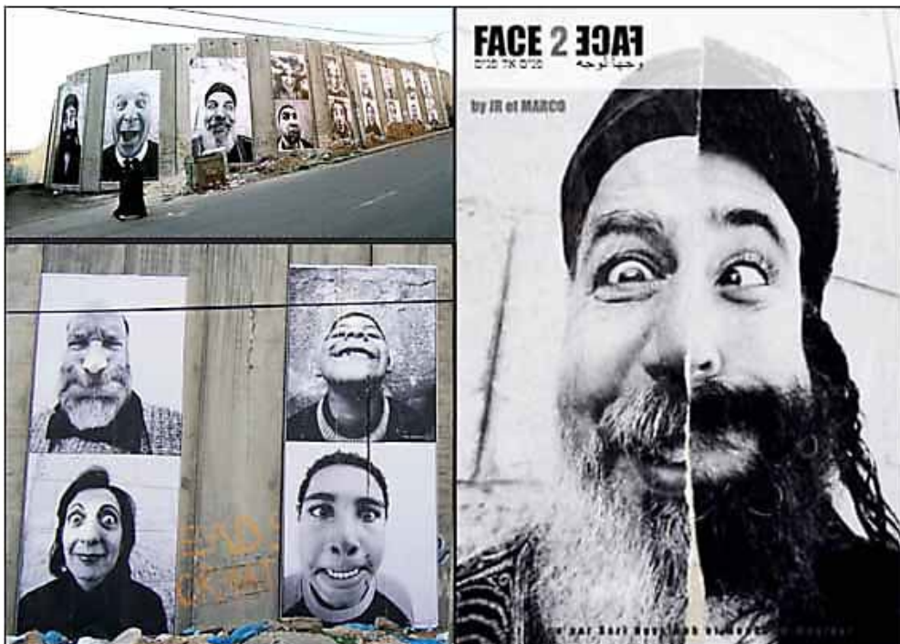
Mur de séparation en l'Israël et la Palestine investi par JR et Marco

Toutes ces notions se construisent dans la continuité de la définition de la rue comme la plus grande galerie du monde. L'artiste JR souhaite, en effet, amener l'art dans la rue pour qu'il soit à la portée de chacun, dans le quotidien, ou à la portée de ceux qui ne vont jamais au musée. L'artiste traite d'engagement, de liberté, d'identité et de limites dans son travail qui mêle l'art et l'action. JR commence par observer les gens qu'il rencontre, écoute leurs histoires et leurs messages. Après ce processus de découverte et de recherches, le photographe prend des clichés des personnes rencontrées et colle leurs portraits dans les rues et d'autres supports de l'espace public. L'anonymat de « l'artiste urbain » 55 et l'absence d'explication de ses portraits géants laissent libre cours à la rencontre entre le sujet photographié et le passant ; c'est l'essence de son œuvre. Dans son projet « Face 2 face » commun avec Marco, les deux artistes réalisent des portraits d'israéliens et de palestiniens.