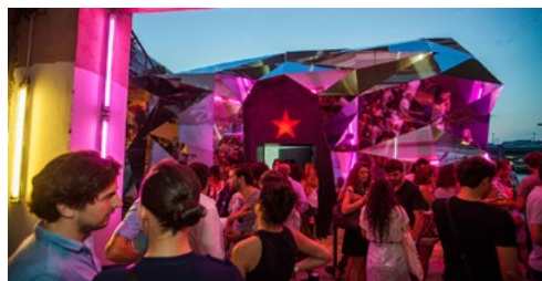
« Extracold Zone » - Halloween Agency - www.halloween.fr