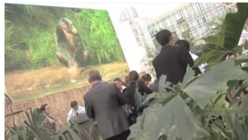
« La Jungle Urbaine » - agence Tokyo - www.agencetokyo.com