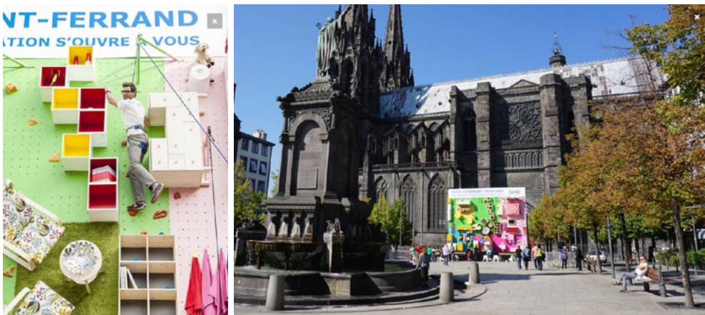
« Gravir les sommets » - Utopik design - www.utopikdesign.fr

Enfin, les agences Ubibene et Utopik Design travaillent ensemble pour aborder les notions de rythme et de récréatif en les jumelant dans le projet « Gravir des sommets » pour Ikea. Ce projet a été préparé en vue de l'ouverture d'un nouveau magasin de l'enseigne. La conception éphémère invite les passants à s'essayer à l'escalade sur un mur aux couleurs d'Ikea. Le mur permet donc de se détendre en s'initiant à un nouveau sport tout en captant l'information que l'installation souhaite diffuser. Le projet peut donc se traduire comme un moment de pause dans le rythme de l'utilisateur de l'espace public, comme un moment de plaisir dans un lieu où l'on passe la majeure partie de son temps à « courir ».