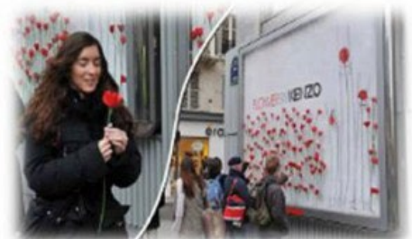
« FlowerbyKenzo » - agences Halloween et KR Media - www.halloween.fr