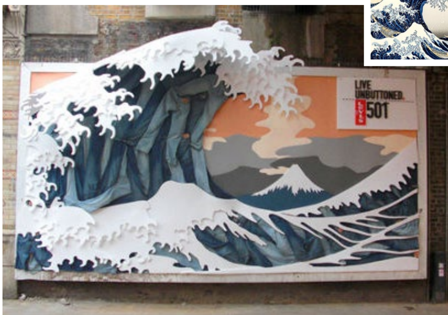
Affichage alternatif « La Vague » et l'oeuvre originale de Katsushika Hokusai.

obtenir plusieurs perceptions, ou même de s'immerger complètement dans la campagne publicitaire.