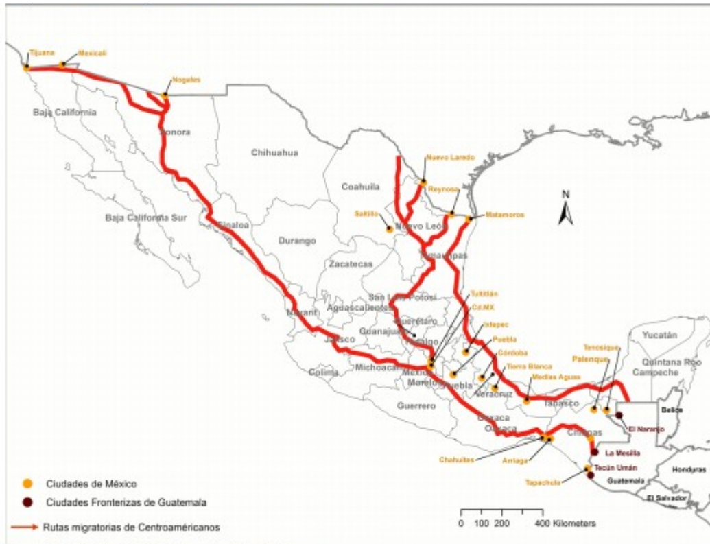
Carte 1 : Routes empruntées par les migrants Centraméricains au Mexique 143 .