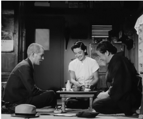
Le repas avec la belle-fille, 0 :44 :41