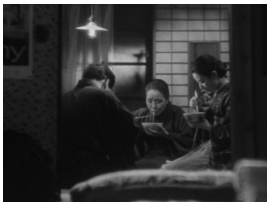
La scène du râmen