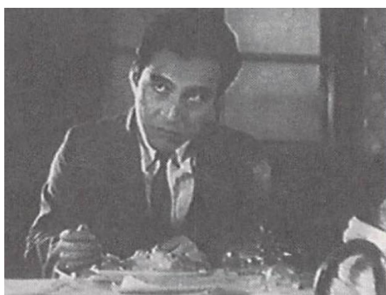
Riz au curry Chœur de Tôkyô , 1933 84

Nous pouvons en conclure que dans sa vie comme dans ce film, le curry est une métaphore ozuïenne de l'obstination, la contestation, la chance, l'ambition, et la détermination. Il reflète aussi le sentiment de reconnaissance d'un jeune homme dévoué envers son bienfaiteur. Ainsi Ozu transposerait, sur ses personnages, son propre vécu émotionnel culinaire pour le transmettre au spectateur. Par ailleurs, ce riz au curry est communément reconnu comme un met « simple » et cuisiné pour de « modestes employés », nous dit Hasumi 83 . Ce plat incarne les goûts et la gastronomie accessible à la petite classe moyenne qui endure les tumultes économiques de l'époque du cinéaste. Des vicissitudes qu'Ozu, lui-même, a rencontré dans sa vie et qu'il représente dans ses films, notamment par un détail culinaire comme un riz au curry.