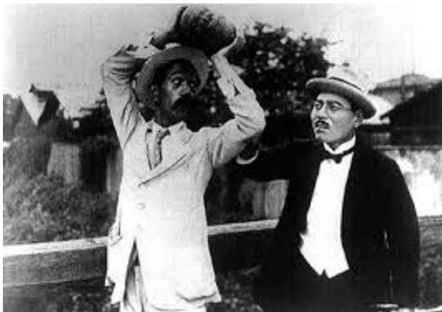
La Citrouille , 1928 99

En 1928, Ozu réalise Kabocha カボチャ (La citrouille). Le scénario de ce film perdu, relaté sur les pages de « Cinéma Classics » 98 est l'histoire d'un petit salarié qui, en raison de sa situation précaire, ne peut s'offrir, en guise de repas, que de la citrouille. Un jour, désespéré, il monte dans un train avec une citrouille et la jette par la fenêtre.