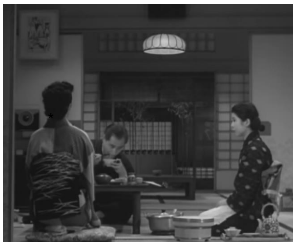
Le Goût du riz au thé vert , 1952 114

en scène et lui dit que sa femme ne va pas tarder. Mais Mokichi à faim et sans attendre commence à manger. En arrière-plan, Taeko fait son entrée d'un pas nonchalant et vient s'asseoir en face de son mari, dos au spectateur. Mokichi, sans vraiment prêter attention à sa femme continue son repas tout en continuant sa lecture. D'un air réprobateur, elle observe chacun de ses gestes, et se met à lui reprocher ses manières grossières. Arroser son riz de soupe de miso puis approcher les baguettes à sa bouche en aspirant bruyamment lui déplait fortement. Elle blâme ses façons de « laper comme un chien ». Mokichi, s'interrompt, regarde son bol d'un air étonné, s'excuse puis reprend ses « mauvaises manières ». Irritée, sa femme repose ses baguettes brusquement et quitte la table sans avoir même commencé à manger. Sans aucune contrariété apparente, Mokichi se fait resservir du riz et poursuit son dîner avec appétit.