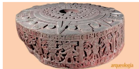
« Pierre de Tizoc », Museo nacional de antropología de México Piedra del arzobispado, Museo nacional de antropología

https://arqueologiamexicana.mx/mexico-antiguo/la-piedra-de-tizoc