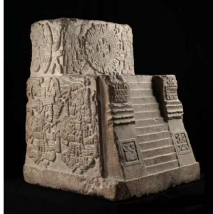
« Teocalli de la guerra sagrada », Museo nacional de antropología de México,

Le cinquième soleil est représenté de manière plus explicite sur le monument qui porte le nom de « Teocalli de la guerra sagrada », grande sculpture en forme de temple, décorée de reliefs sur la plupart de ses faces.