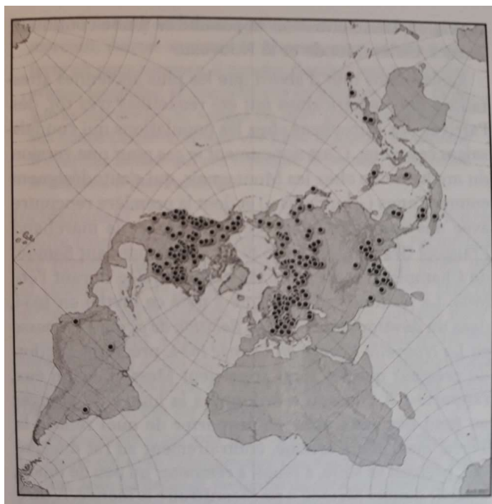
Répartition mondiale des 487 récits du mythe du plongeon cosmologique, selon la projection de Peirce, qui nous permet de situer sa localisation dans l'hémisphère nord. Image extraite de Jean-Loïc Le Quellec, L'humanité et ses mythes .

Cette projection permet de constater que certains mythes ont pu être « transportés » par des populations lors de mouvements migratoires dans l'hémisphère nord, entre l'Eurasie et l'Amérique du Nord, à une époque lointaine où la géographie du lieu le permettait. Les mythes ont par la suite subi des évolutions, des transformations mais certains motifs ont pu perdurer, à l'exemple de celui de la disparition du soleil plongeant la terre dans l'obscurité. C'est pour cette raison qu'étonnamment, nous pouvons les retrouver parmi des populations n'ayant jamais été en contact.