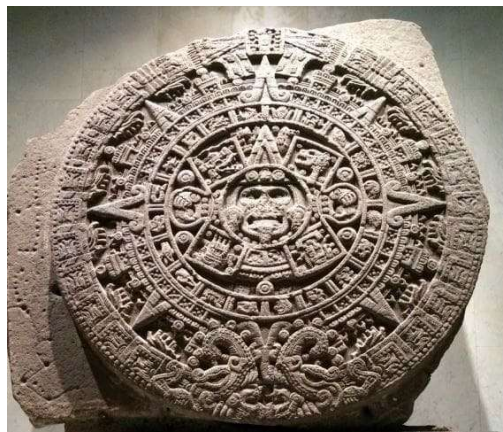
« Pierre du Soleil », Museo nacional de Mexico,

Il n'est pas possible de citer les monuments archéologiques représentant le soleil et notamment la légende des cinq soleils sans citer l'œuvre monumentale majeure aztèque qu'est la « Pierre du Soleil ». Découverte le 17 décembre 1790 à proximité de la place du Zocalo de Mexico, elle est exposée actuellement au Museo Nacional de Mexico .