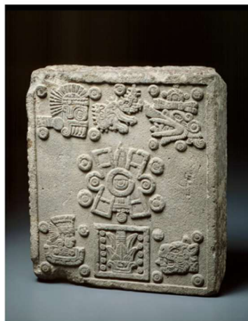
« Pierre du couronnement », Art Institute, Chicago,

La « Pierre du couronnement 33 », exposée au Art Institute de Chicago , confirme, du point de vue de l'histoire des arts, la légende des soleils.